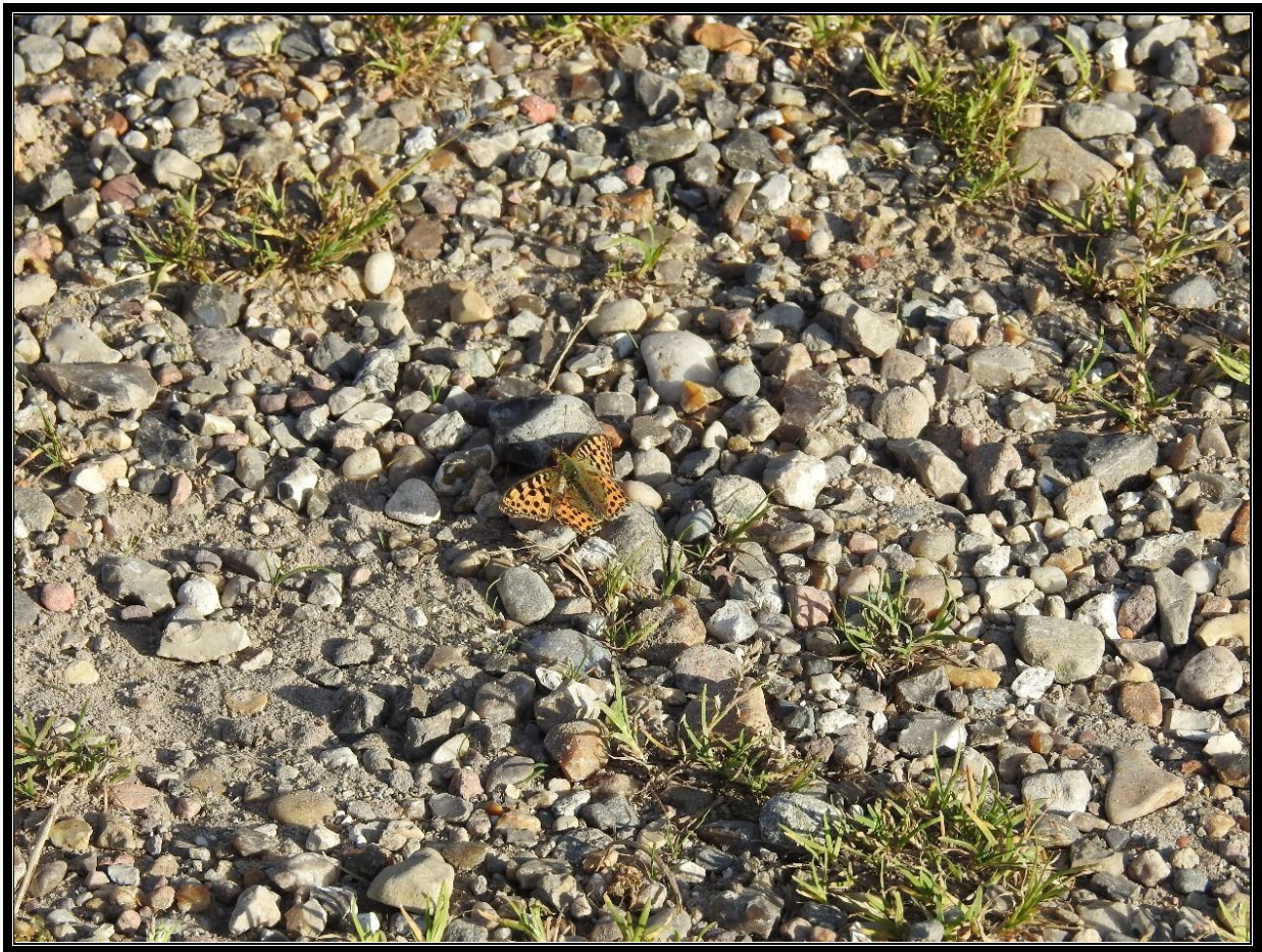
Storplettet Perlemorsommerfugl – 13. august