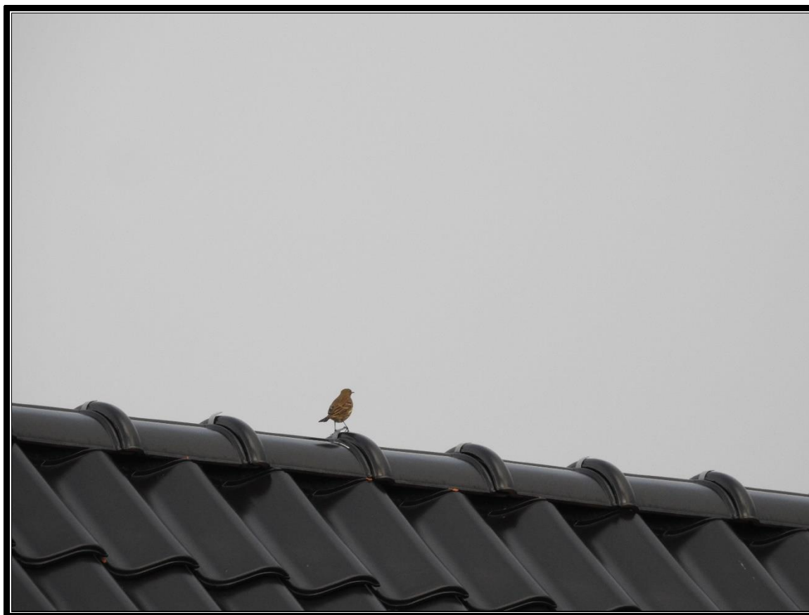
Skærpiber – ny til artslisten, januar

Området er blevet optalt på samme måde hver gang, hvilket vil sige at vi er startet med udgangspunkt fra Heboltoft 54, gået forbi søerne tæt på parcelhusene og øst over ad "Strandvejen" og herefter videre mod arealerne øst for banen, hvorefter turen er gået retur igen og sydover mod den store sø, rundt om den og retur af grusvejen "Strandengen" midt i arealet tilbage til Heboltoft 54.