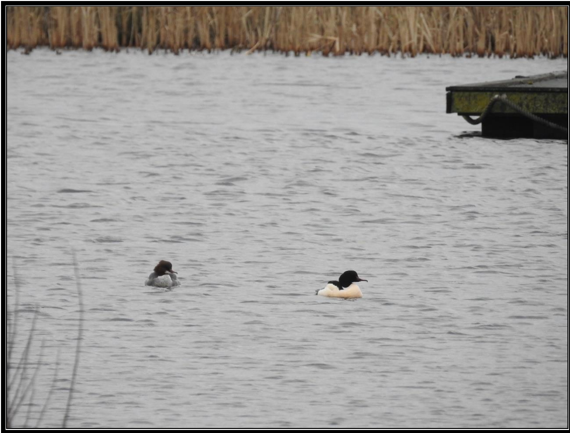
Stor Skallesluger, han og hun - januar