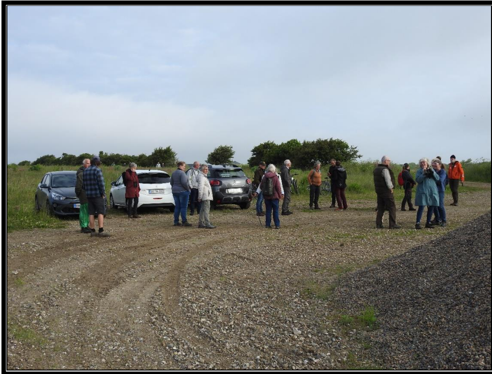
Her foto fra starten på årets fugletur i Naturbydelen

I 2022 havde DOF-Vestjylland 50års jubilæum og i den forbindelse var der arrangeret 2 busture og her havde den ene "Ringkøbing K" på programmet, så herunder foto fra besøget 24. september