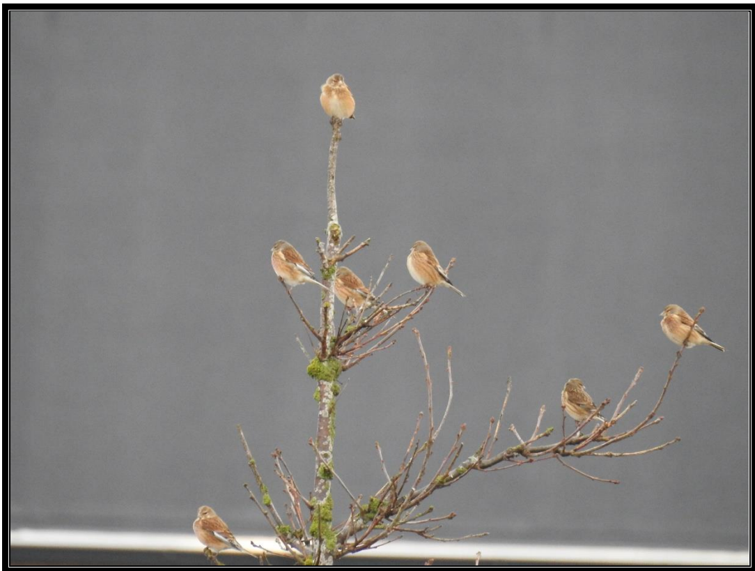
Bjergirisk – januar