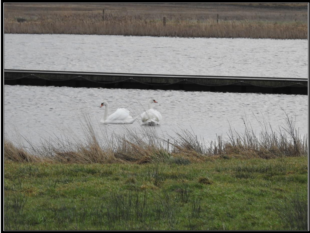
Knopsvaner i den store sø, januar

Den samlede fugleliste observeret på tællegruppens i alt 67 tællinger i Naturbydelen er således på 131 arter.