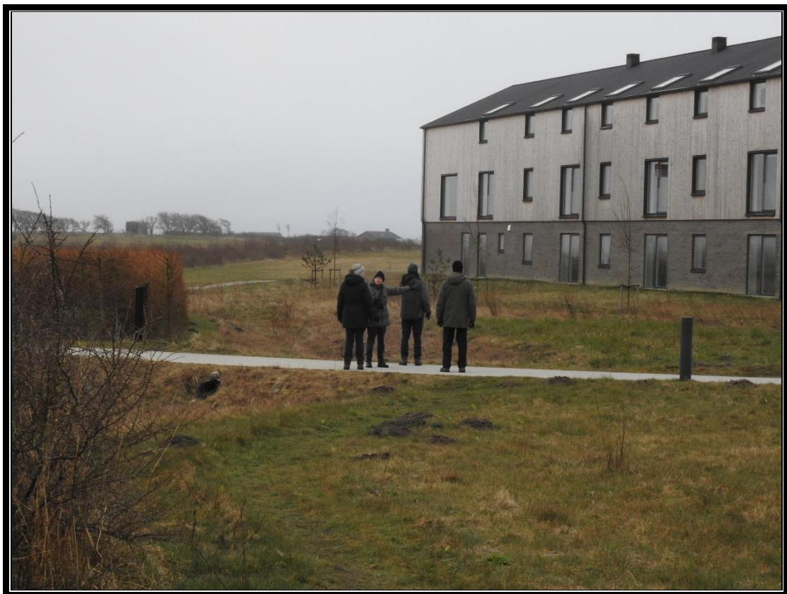
Tælletur – marts

I løbet af 2022 er der igangsat endnu en etape af boligområdet "Fjordudsigten". 33 lejligheder yderligere vil blive færdiggjort i 2023 og alt i alt vil der så være 80 udlejningslejligheder ejet af Ringkøbing-Skjern boligforening. Der er yderligere et igangværende byggeri i Strandkanten.