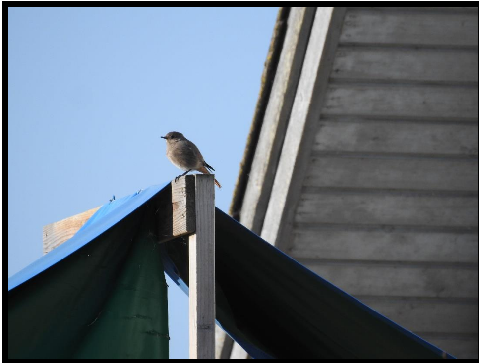
Her Husrødstjert, som var ny art for Ringkøbing K på oktobertællingen

Henover året sker der hele tiden noget nyt og det er jo det spændende og interessante ved fuglene, at der er mange arter, med vidt forskellige strategier og levemåder. Nogle er standfugle og opholder sig året rundt i samme område, andre er trækfugle, hvor nogle kommer sydfra og er her om sommeren for at yngle, mens andre er trækfugle og yngler længere nordpå og er så måske hos os om vinteren og tillige er der også arter, som ses i en kortere eller længere periode i træktiden – forår og efterår.